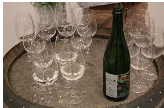
飯綱町産シードル