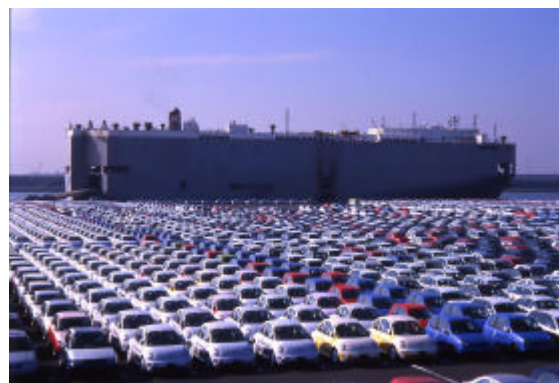
【全国の約 50%を占める自動車輸入港】