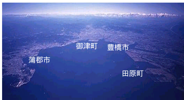
【世界を代表する日本一の自動車港湾三河港の全景】