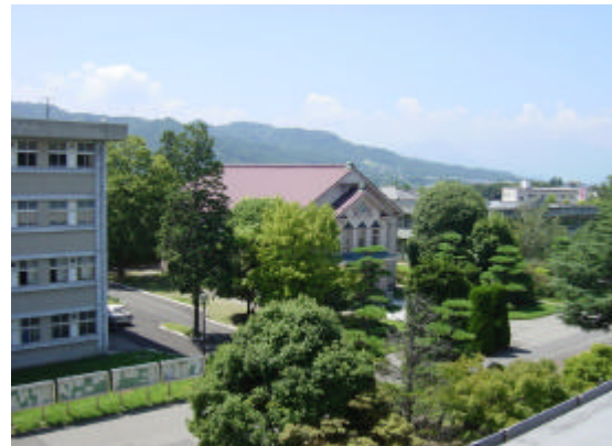
【信州大学繊維学部】