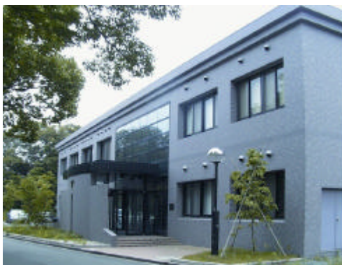
メディカルフォトンクスに取り組む 浜松医科大学光量子医学研究センター