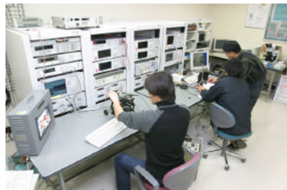
高性能イメージセンサ開発に取り組む 静岡大学電子工学研究所