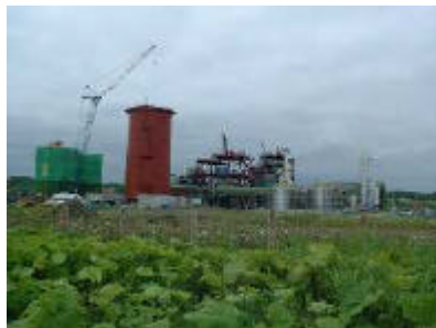
【DME 100 t/日 実証プラント】