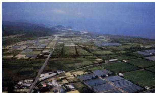
万世・小湊海浜地域