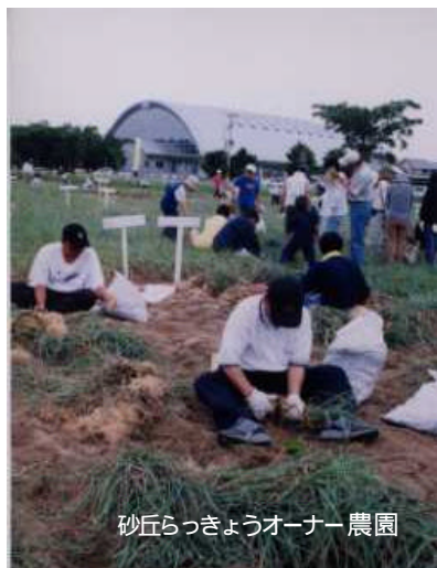
砂丘らっきょうオーナー農園