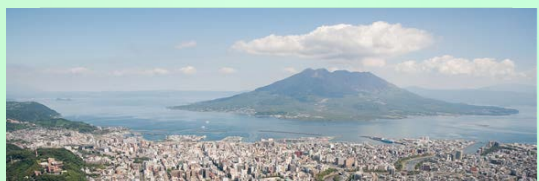
世界文化遺産候補 （磯地区）