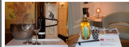
関東地域の地域資源を組み合わせたギフトボックス