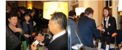
大使館関係者や海外メディアにPR