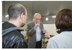
ベンチャーウイスキー(埼玉県秩父市)