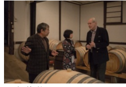
中央葡萄酒(山梨県甲州市)