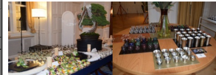
食と盆栽の融合 各地のこだわりの器