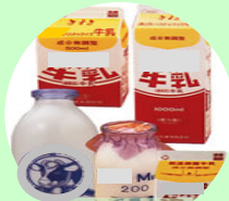
乳製品を活かした新商品づくり