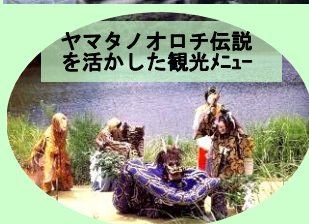
ヤマタノオロチ伝説を活かした観光メニュー