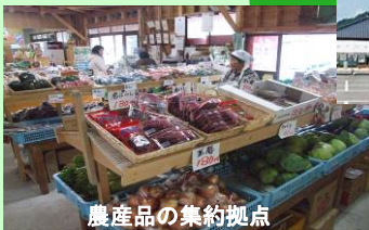
農産品の集約拠点