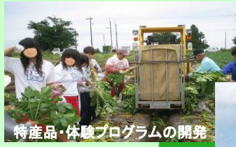
特産品・体験プログラムの開発

市内6箇所にある「道の駅」を活用し、1駅逸品(1品)開発事業や低コスト物流モデル・地消システム構築の実証実験を行うとともに、地域を牽引する人材を育成することで、高齢化の進展に対し、自立し、循環し、持続する地域経済の確立を図る。