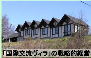
「国際交流ヴィラ」の戦略的経営