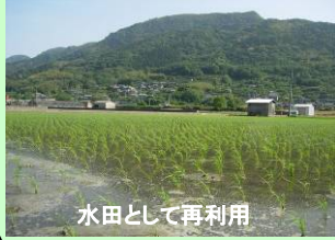
水田として再利用