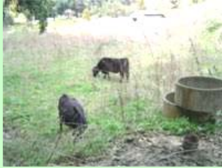
耕作放棄地の現状

高齢農家・不在地主の増加による耕作放棄地の拡大に対応するため、モデル地区を選定し「ありたい土地利用」につき地域住民の合意形成を行うとともに、地域管理会社の設立準備を行うなど、地域住民ぐるみで取り組む活動モデルの構築を図る。