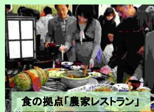
食の拠点「農家レストラン」