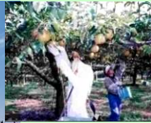
果樹園(梨)における 農業体験