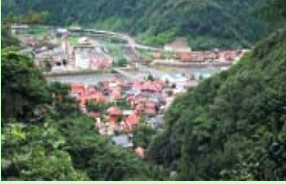
津和野町の市街地

過疎や高齢化が進み、地域の担い手が不足している中山間地域において、住民の日常生活を支えるあらゆるサービスをワンストップ、有償で担うコミュニティビジネスを立ち上げ、生活利便性の向上と地域雇用の創出を図る。