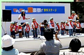
市民音楽祭の開催