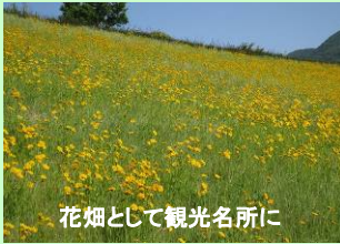
花畑として観光名所に