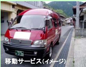
移動サービス(イメージ)