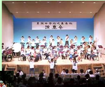
市内中学校の演奏会