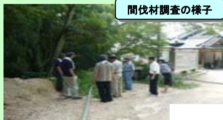
間伐材調査の様子

地場産業である「府中家具」の高い技術を活用し、間伐材を用いて新商品を開発するとともに、木のある暮らしを再評価・PRして、地域ブランドとして展開することで、間伐材の需要増と供給体制を確立し、低迷する地場産業全体の底上げを図る。