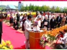
観光農園での結婚式(企画商品の例)