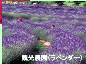
観光農園(ラベンダー)