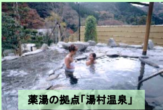
薬湯の拠点「湯村温泉」

歴史・神話にまつわる観光資源、優れた食品を生み出す企業など、地域の潜在力を活かし、風土記に記される温泉や「食の拠点づくり」といった活動を軸に、滞在・交流型観光を進め、雲南圏域における交流人口の拡大とコミュニティの活性化を目指す。