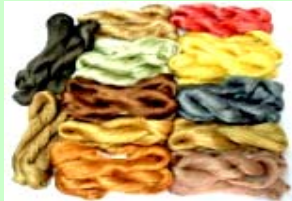
天然染料で染めた綿

しまなみ海道に沿う各地域において、伝統的な文化・産業である「綿」を基軸に、その継承と新たな地域イメージを創出するとともに、「綿」を活用したコミュニティビジネスを構築・展開することにより、地域を繋ぎ、持続的かつ自立的な活性化を創造する。