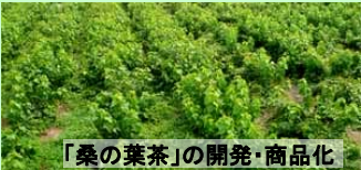
「桑の葉茶」の開発・商品化