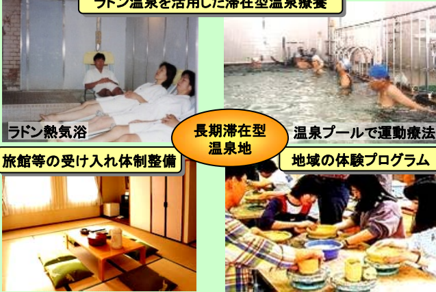
ラドン温泉を活用した滞在型温泉療養

我が国で最も高濃度のラドン放射能泉を活用し、温泉医療施設と旅館等の連携により滞在型の温泉療養を提供するとともに、地域の特色を活かした体験プログラムを開発し、健康増進のための長期滞在型温泉地として活性化を図る。