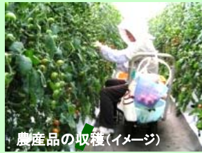
農産品の収穫(イメージ)