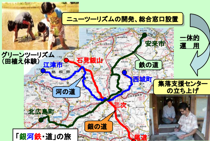
ニューツーリズムの開発、総合窓口設置

中山間地域の資源を活用したニューツーリズムをローカルビジネスとして定着させ、これを収入源に過疎・高齢化した集落の生活支援・集落運営支援を一体的に実施することで、中山間地域の集落機能を再生し、持続的に維持するモデルを構築する。