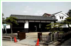
美観地区内アンテナスペースにおける特産品の販促