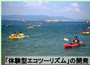
「体験型エコツーリズム」の開発