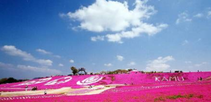
観光農園(シバザクラ)

清涼な気候、田園景観、フルーツ・フラワー農園の集積といった観光の魅力を活かし、農業、土産物の製造・加工、流通・販売・飲食などの各産業を一体的に地域の総合産業と捉え、スローライフエリアとしての「せら高原」の価値向上と、農工商業の振興を図る。