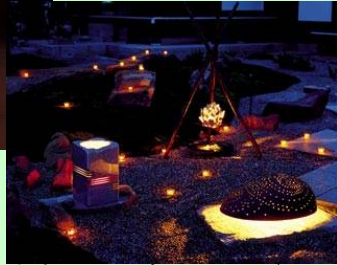
むれ源平石あかりロード