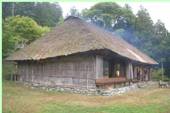
東祖谷地域の茅葺古民家

過疎・高齢化に直面する山村集落の茅葺古民家や秘境の食材、歴史・文化などを地域資源として捉え直し、日本文化に関心の高い内外の潜在的来訪者に伝統的な田舎暮らしのライフスタイルそのものを提供する新たな山村滞在型観光モデルを構築する。