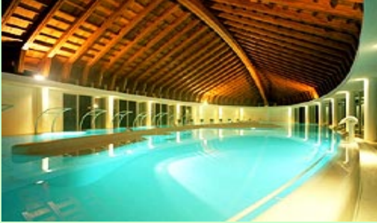
室戸の海洋深層水を活用した健康増進施設

動脈硬化の抑制や糖尿病予防に効果のある海洋深層水に着目し、地元の自然食材など様々な地域資源を磨き・つなぐことにより室戸を楽しみながら理想的に『運動』、『食』、『休息』を実践できる長期滞在型健康プログラム『次世代の湯治湯』を提供。「健康観光産業」として定着させ、雇用増、交流人口の拡大により地域活性化を図る。