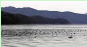
真珠をはじめ豊富な水産資源を育む宇和海

宇和島市が地域づくりの協働協定を結ぶ全日空グループをはじめ大手の百貨店、飲料メーカー、地元愛媛大学等の産学官連携の支援・協力のもと、戦略的観光地づくりの研究、真珠等の地域資源を活用した新商品、新サービスの開発による新事業創出、中心商店街の振興など複合的な取り組みによって宇和島圏域の活性化を目指す。