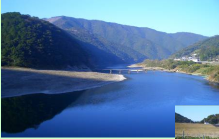
豊かな自然を有する四万十川

四万十川の自然環境と安全・安心な地域の食材を組合せたこの地域ならではのエコツーリズムを展開するとともに、アオノリに含まれているビタミンB12、鉄分などの健康増進有効成分を活用し、付加価値を付けた商品開発や生産量向上等の取組みを行う。