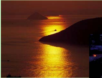
瀬戸内のしまなみ

瀬戸内海や里山など地域の資源を見直し、複合的に組み合わせ現代の観光コンテンツとして再生。地域活性化の担い手となる人材の育成、市民参加による情報発信と併せて観光交流人口の持続的な拡大を図り、本四架橋開通による支店経済の凋落などによる地域力の低下を市民・地域関係者が主体的に連携してプラス方向に転換。