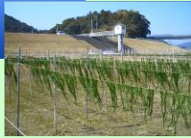
アオノリの乾燥状況