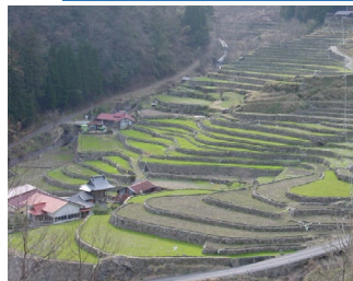
吉賀町大井谷地区 の棚田