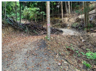
壊れない作業 路網