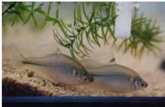
絶滅危惧種 スイゲンゼニタナゴ