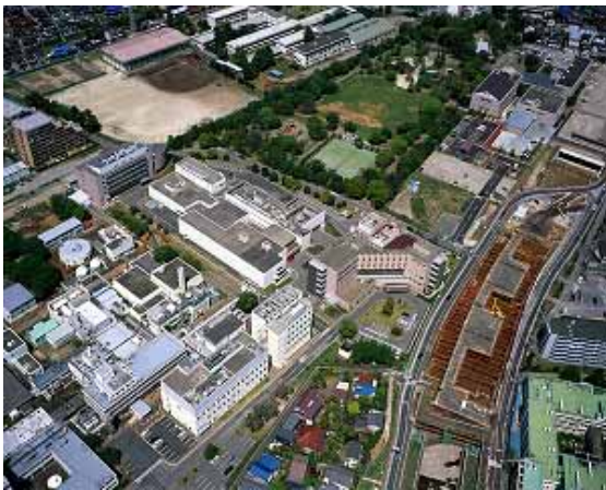
放射線医学総合研究所