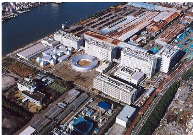
理化学研究所横浜研究所 横浜市立大学鶴見キャンパス