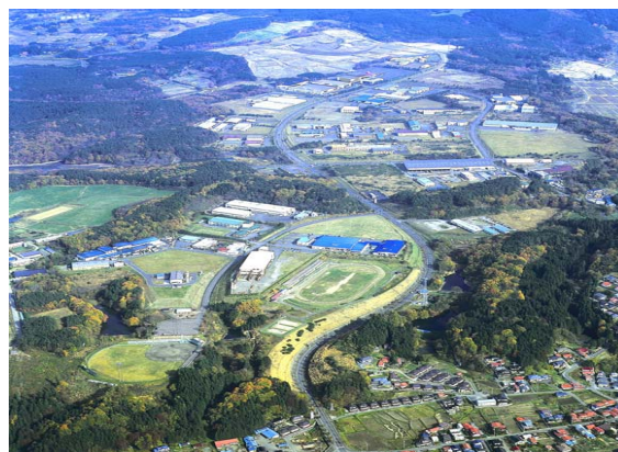
企業誘致が進む工業団地