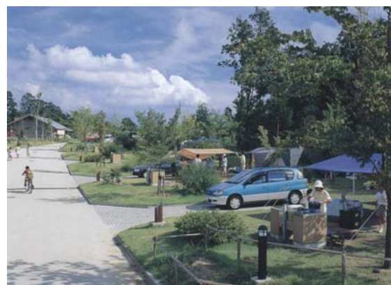
吉井竜天オートキャンプ場