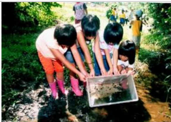
ほたるの幼虫を放流