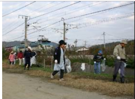
クリーン作戦（町内一斉清掃）