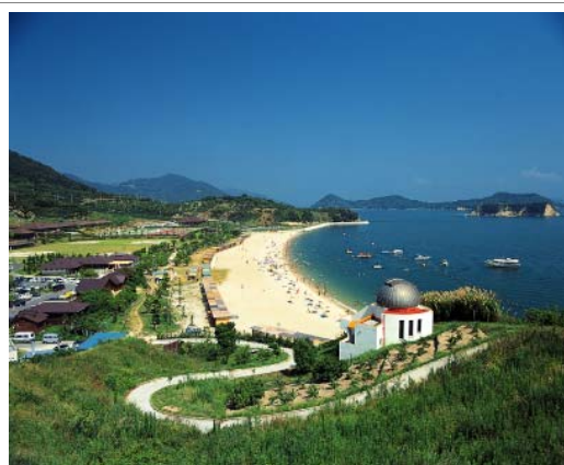
観光・レクリエーション施設