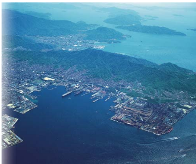
瀬戸内海に臨む市街地