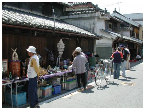
二層うだつの町並み