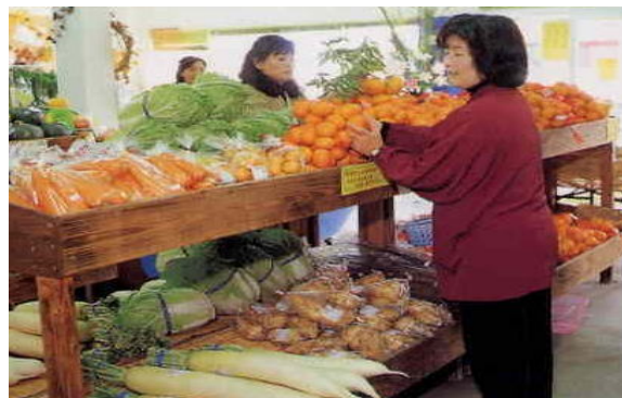
○農産物直売所での販売