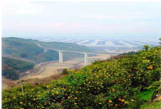
○多良岳丘陵地帯と広域農道