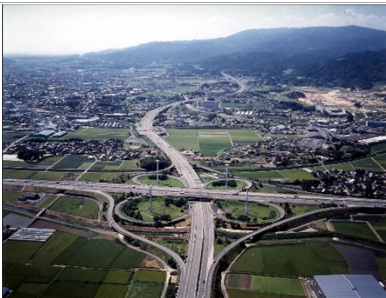
鳥栖 JCT と再生計画地域