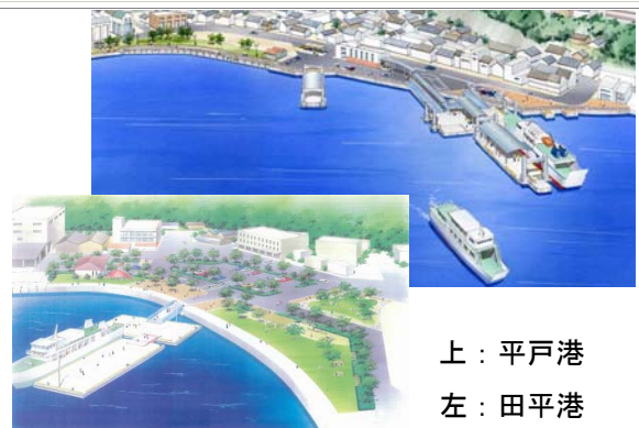
上：平戸港 左：田平港