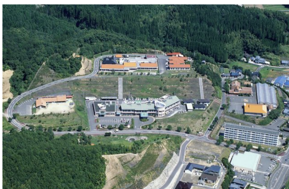
福祉施設群の「ひだまりの里」(写真中央が病院)