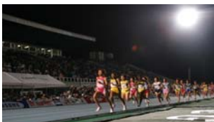
ゴールデンゲーム in のべおか