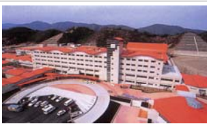
九州保健福祉大学