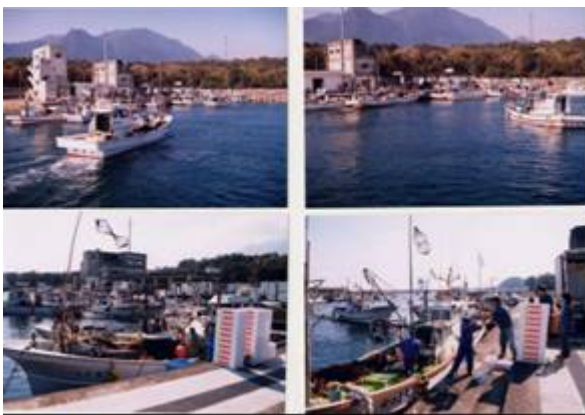
安房港 水揚げ状況