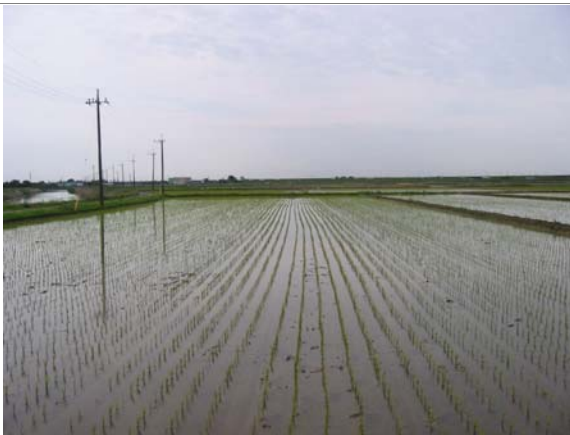
〈長井戸沼土地改良区内水田〉