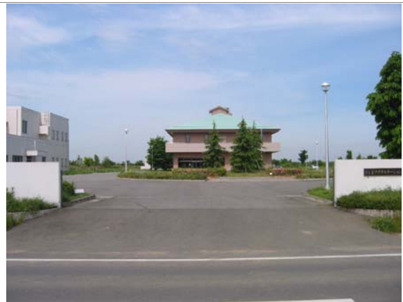
〈さしまアクアステーション処理場〉