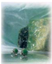
ヒスイの原石と加工品