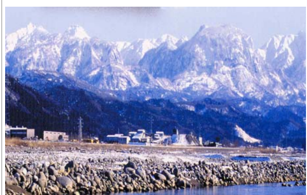
姫川から望む北アルプスの山々