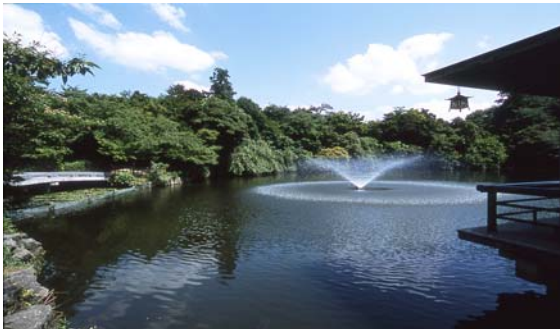
高岡城跡（古城公園）