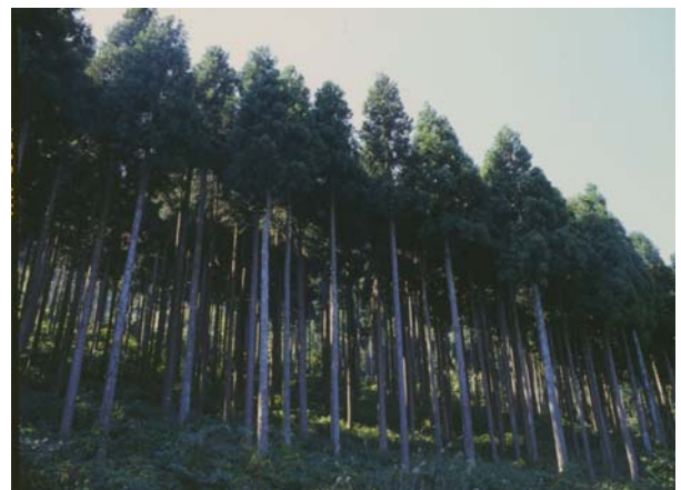
森林施業の効率化