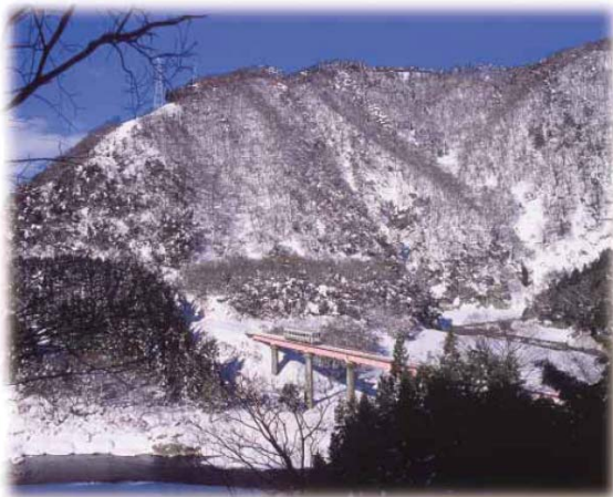
森林へのアクセスを確保