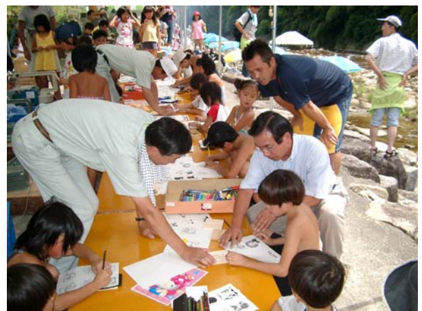
都市農村交流（都市との共生・対流）