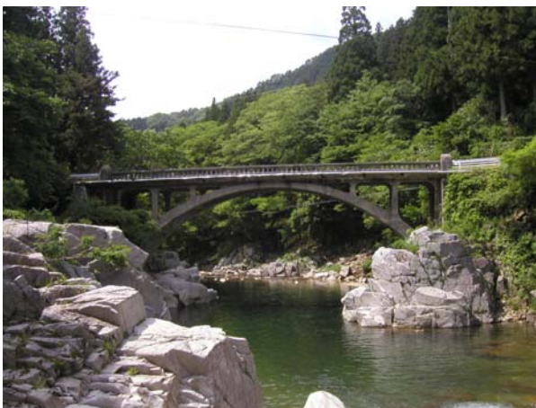
村道幹 I - 1 号線