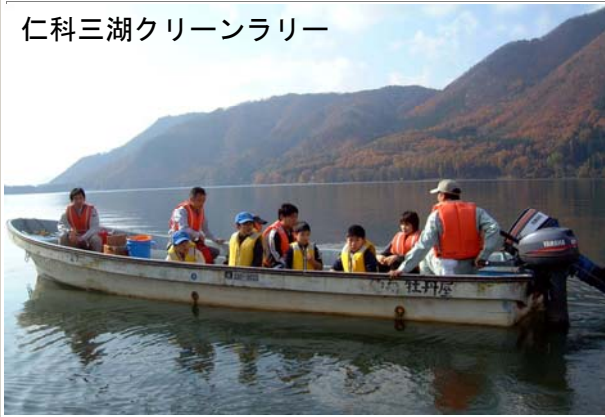
仁科三湖クリーンラリー