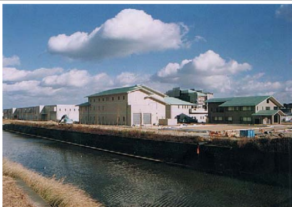
湖西浄化センター