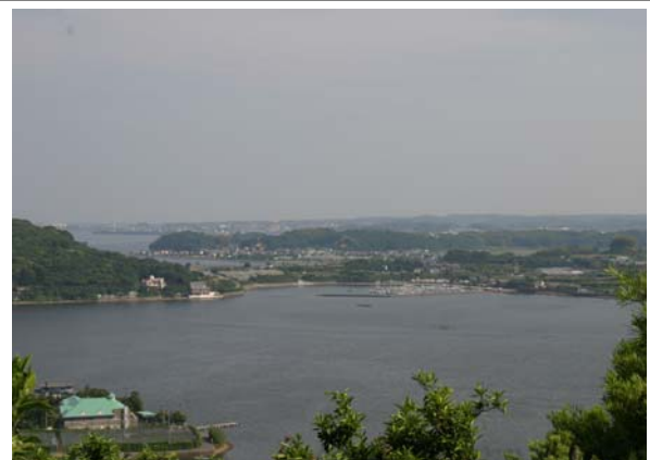
浜名湖と緑豊かなまち