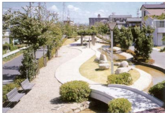
下水道散策路はやかわ