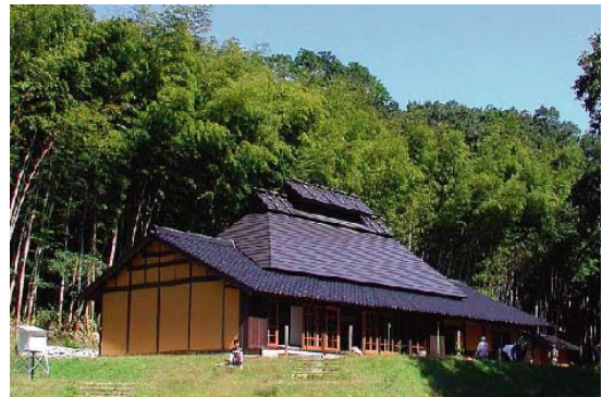
おかざき自然体験の森