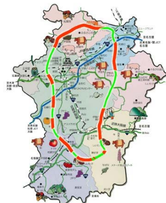
伊賀コリドール計画