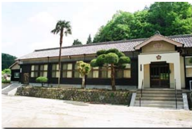
地域の活動拠点 博要の丘（旧博要小学校）