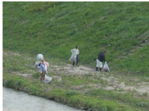
市民参加による美化運動