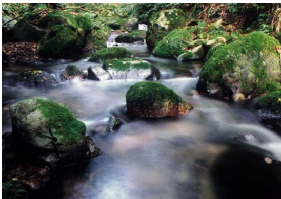
清らかに澄んだ水の創造