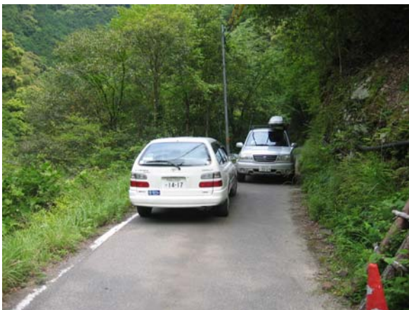
町道西敷屋篠尾線改良計画地