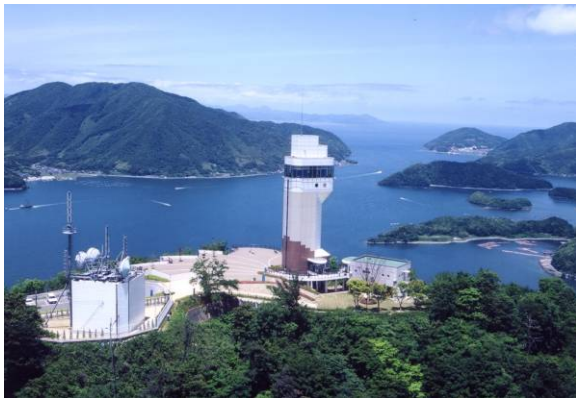
波静かな天然の良港 舞鶴湾