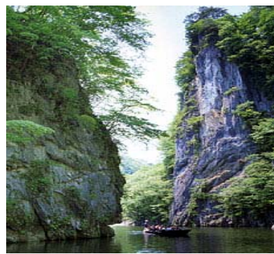
砂鉄川の清流化が進む日本百景「狛鼻溪」、 澄みきった溪谷と船下り