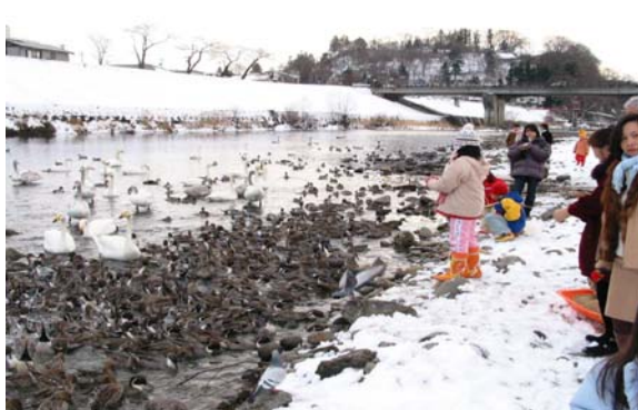
水質浄化により渡り鳥とふれあいの場が生まれた 磐井川