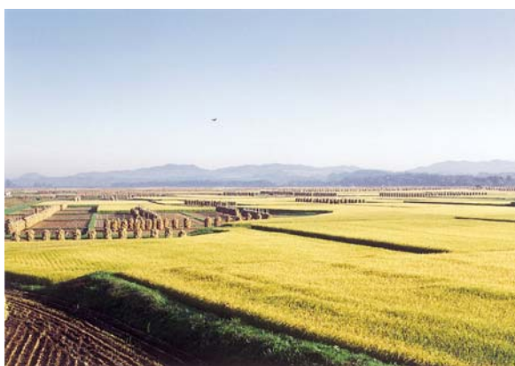
北上山地につながる田園地帯