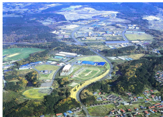
企業誘致が進む工業団地