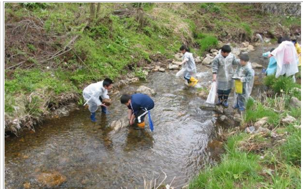
(写真) 町内小学校による川の水質調査