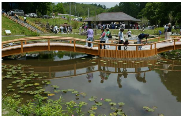
(写真) いわてまち川の駅