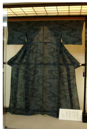
伝統工芸品(平成20年度商標登録) 宮古上布