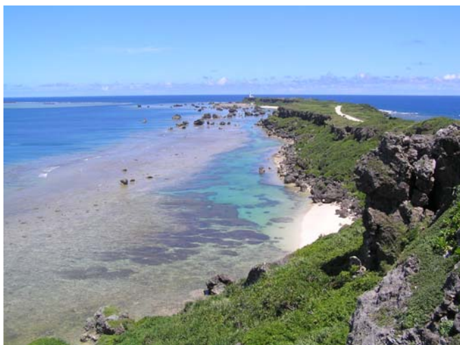
日本都市公園百景に認定された ひがしへんなぎさき 東平安名崎