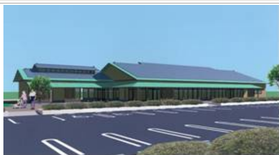
農畜産物直売所（イメージ）