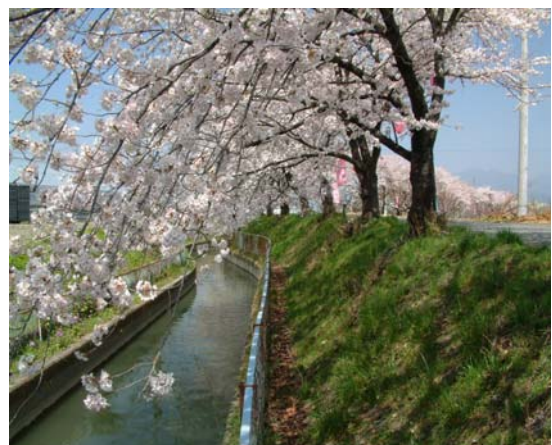
市の西部を流れる畑地かんがい用水路 (徳島堰)