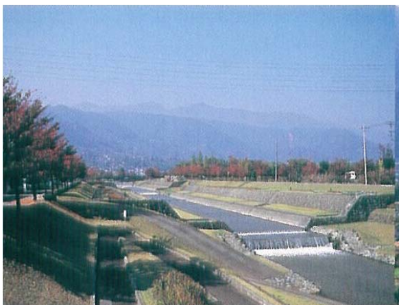
市の中央を流れる滝沢川