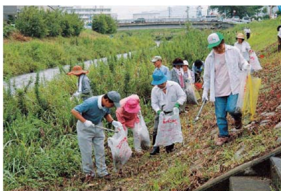
市民団体による環境美化活動