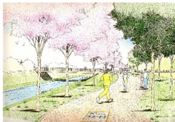
河川堤防を活用した緑道