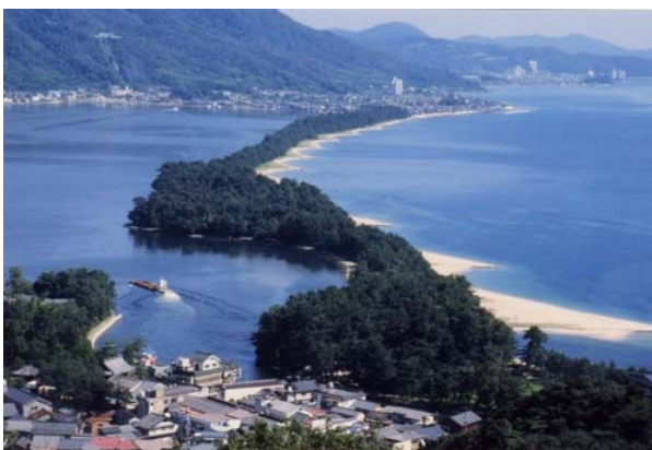
日本三景『天橋立』 飛龍観