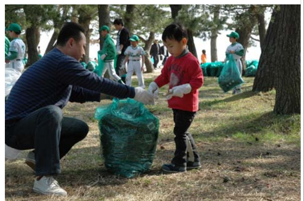
『クリーンはしだて1人1坪大作戦』 「天橋立を守る会」による清掃・美化活動