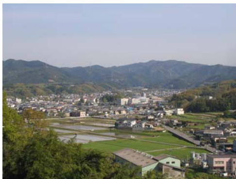
美しい山々、豊かな自然に囲まれた宇治田原町