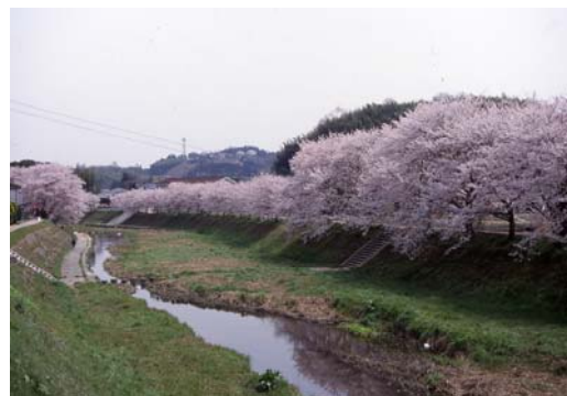
春は桜、夏はホタル、住民に親しまれる川づくり