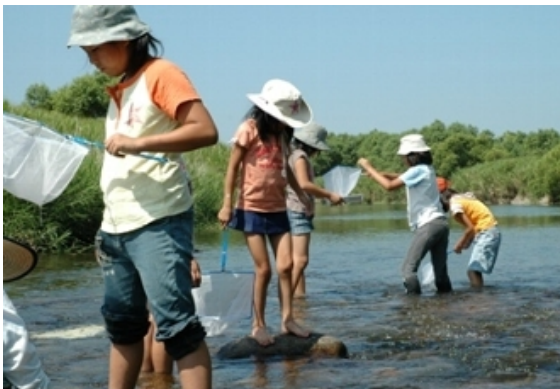
佐波川「水生生物観察会」