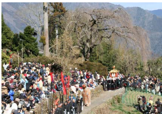
土佐三大祭りの一つ「秋葉まつり」