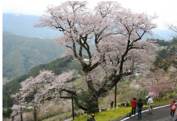
樹齢約五百年の巨樹「ひょうたん桜」