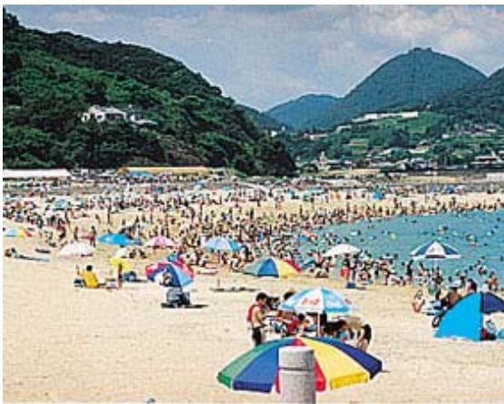
結の浜マリンパーク