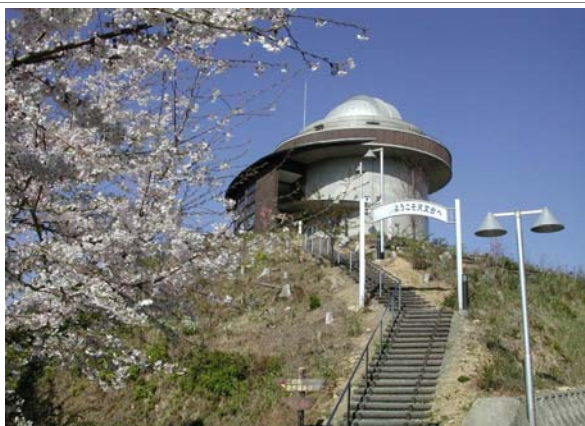
さかもと八竜天文台